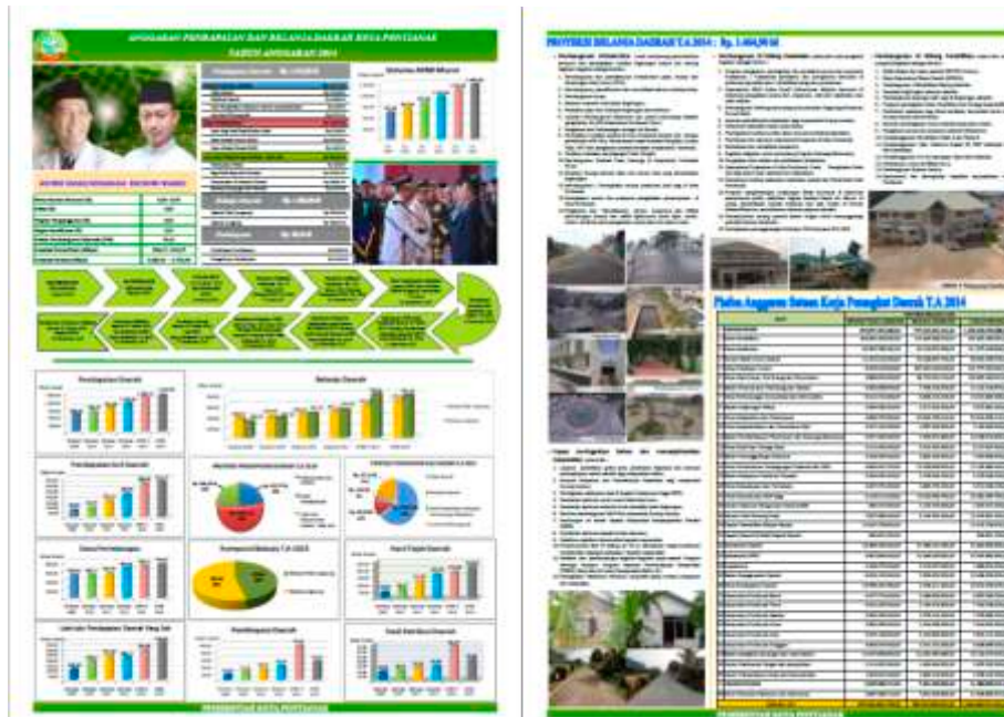
Gambar 1. Tampilan Publikasi APBD Kota Pontianak Tahun 2014 di Harian Lokal